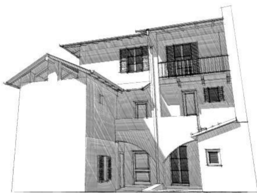
Vista 3 stato di fatto