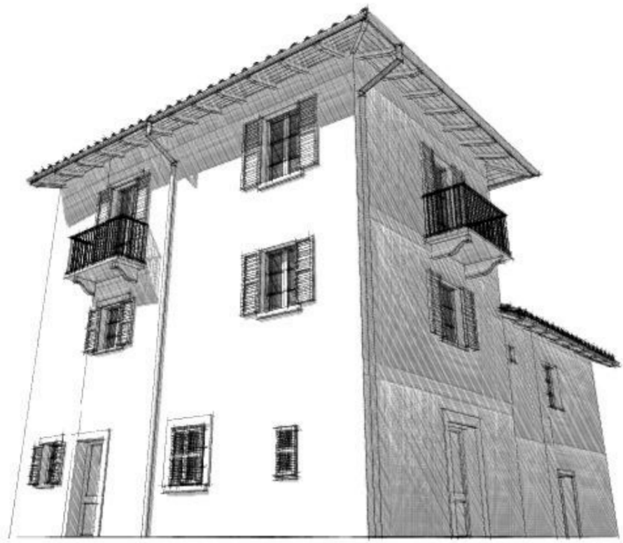
Vista 1 stato di fatto