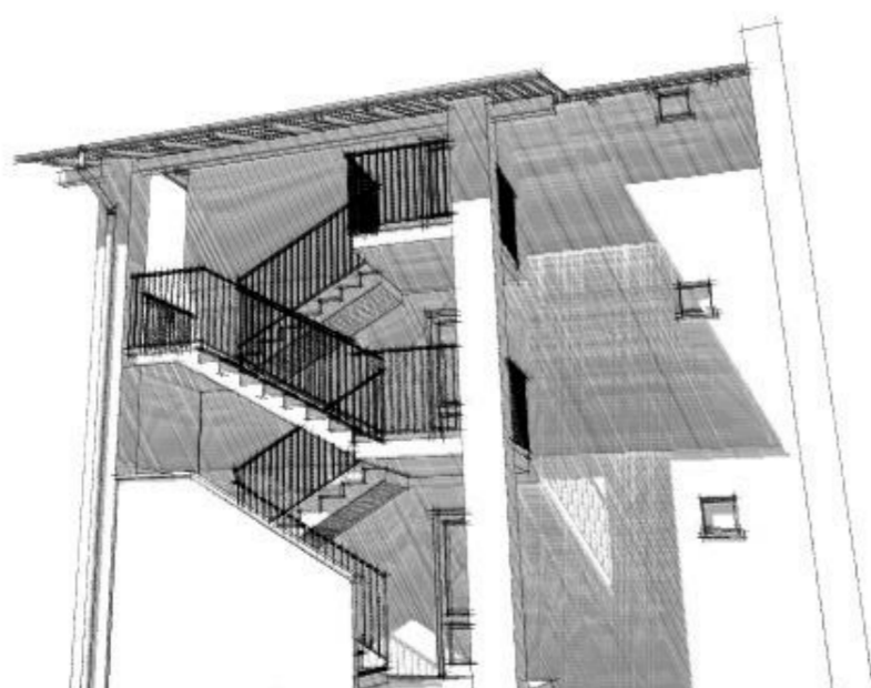
Vista 3 progetto

REGIONE PIEMONTE PROVINCIA DEL VERBANO CUSIO OSSOLA COMUNE DI BAVENO Proprietà "AZALEA DI BELTRAMI PAOLO E C. S.A.S." Via Domo n. 3-5 - BAVENO