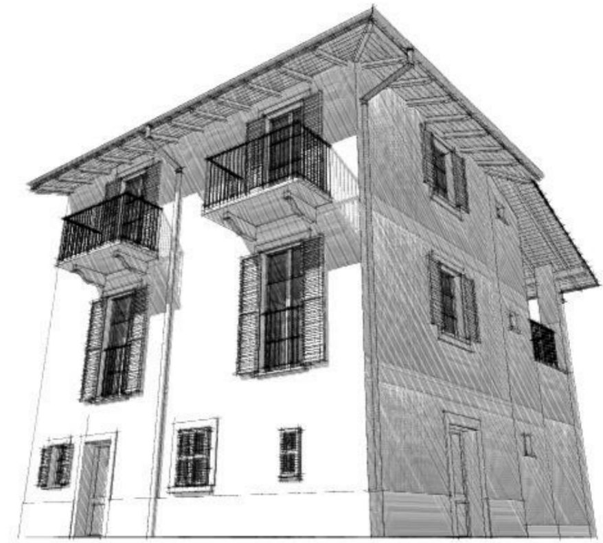
Vista 1 progetto