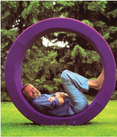
Verner Panton, Sitting Wheel , 1974

Pur seguendo delle “norme” (normative), inoltre, il piano non intende scadere nella banalità (normalità), in quanto assicurarsi che ci sia un sacrosanto rispetto delle regole, non significa rendere tutto appiattito e senza stimoli.