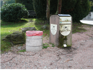
Dog box in graniglia

molto rovinato e percettivamente non richiama all'attenzione (manufatti che si confondono, mimetizzano con il contesto attorno, a volte perdono la loro connotazione e non riescono ad essere visti, non rispondendo quindi all'istanza principale per la quale sono stati collocati sul territorio).