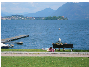
Panchina in estate sul Lungolago di Baveno

Spesso le persone sostano sulle panchine per osservare il paesaggio, leggere, chiacchierare, mangiare un gelato.