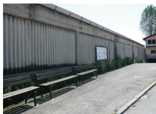
Visione frontale alla casa per anziani